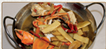
542 Granchio Wok