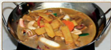
805A Calamari Wok