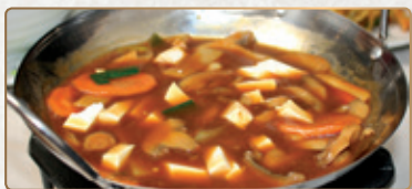
213A Tau-fu Wok