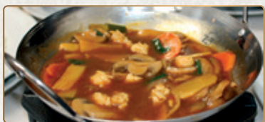
518A Rane Wok