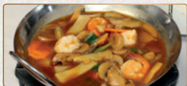
205A Gamberetti Wok