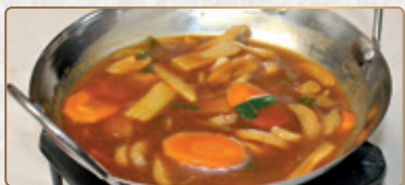
204A Manzo Wok